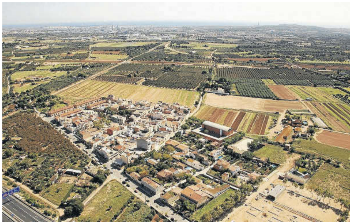
Vista aérea de La Plana, que en un futuro tendrá un vial de conexión directa a Vila-seca.

Pero no solo se trata de la unión con La Plana. Si bien el Raval de la Mar ya llega a La Pineda, otro de los objetivos es mejorar el último tramo hasta el paseo marítimo. Una conexión que ya existe, «pero se trataría de darle un sentido de más de amplitud, que acabe de vestir la continuidad hasta la playa y haga más visible su llegada al mar», remarca Poblet. E insiste: «Debe generar conciencia de que nuestro municipio no se compone de tres núcleos desenganchados, sino articulados por un corredor central».