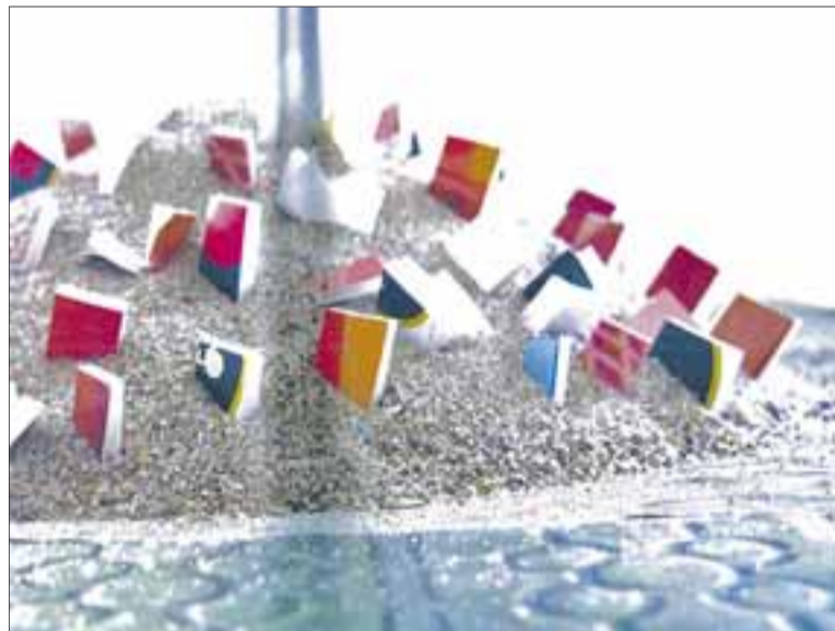
La plaza de Voltes acogerá una escultura con libros enterrados en una montaña de arena.

Ayuntamiento. Los libros cubrirán accesos, puertas y ventanas. «Pondrá en escena, de forma simbólica, la situación de negar el paso a las personas».